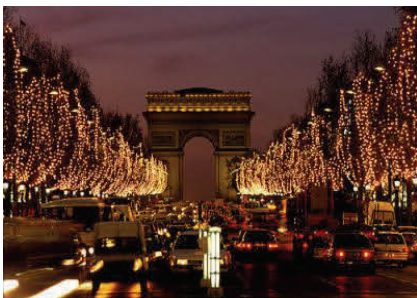
Παρίσι — Γαλλία : Η στολισμένη Λεωφόρος των Ηλυσίων Πεδίων με την Αψίδα του Θριάμβου

Τα Χριστούγεννα στη Γαλλία αποτελούν την εορταστική κορύφωση του έτους. Σε αντίθεση με άλλες ευρωπαϊκές χώρες η εποχή πριν τα Χριστούγεννα είναι λιγότερο σημαντική.