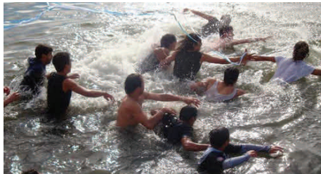
Θεοφάνεια : Ψάχνοντας τον σταυρό !

γιορτάζουμε τη βάπτισμα του Ιησού Χριστού από τον Ιωάννη τον Πρόδρομο ή Βαπτιστή.