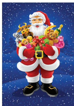
Ο Santa Claus

Συμπλήρωσε τις σπουδές του στην Καισαρεία, στην Κωνσταντινούπολη και αργότερα στην περίφημη φιλοσοφική σχολή της Αθήνας. Σπούδασε ρητορική, φιλοσοφία, αστρονομία, γεωμετρία, ιατρική, φιλολογία και φυσική στην Αθήνα. Αφιέρωσε όλη τη ζωή του στην αντιμετώπιση σοβαρών προβλημάτων της Εκκλησίας και στη φροντίδα του ποιμνίου του. Ο Μέγας Βασίλειος πέθανε την 1η Ιανουαρίου του 379 σε ηλικία μόλις 49 χρονών και πάμφτωχος. Άφησε όμως πίσω του ένα πλούσιο έργο. Εκτός από τα αμέτρητα συγγράμματά του και τη μάχη του εναντίον του αρειανισμού, έγινε γνωστός κυρίως για τη φιλανθρωπία του.