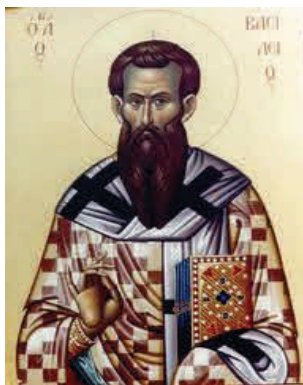
Ο Άγιος Βασίλειος

Καισαρεία, στο Βυζάντιο και στην Αθήνα. Σαν επίσκοπος βοήθησε πολύ τους φτωχούς, τους γέροντες, τους αρρώστους, τα ορφανά παιδάκια και γενικά τους δυστυχισμένους ανθρώπους. Ξόδεψε όλη του την περιουσία και ίδρυσε νοσοκομεία, φτωχοκομεία και άλλα φιλανθρωπικά ιδρύματα. Γι' αυτό τη μέρα της γιορτής του, όλα τα παιδάκια παίρνουν δώρα.