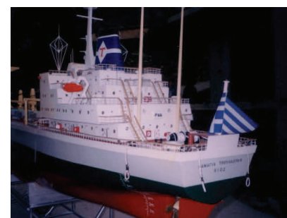
Καραβάκια από τη Χίο

Κάθε χρόνο την παραμονή της Πρωτοχρονιάς αναβιώνει στην κεντρική πλατεί-