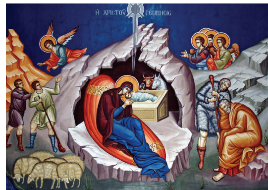
Η Θεία Γέννηση στη βυζαντινή αιογραφία

Ο Χριστός γεννήθηκε στη Βηθλεέμ μέσα σε μια φάτνη. Μητέρα του Χριστού ήταν η Μαρία, η Παναγία όπως την ξέρουμε. Ένα βράδυ που η Μαρία κοιμότανε ένας άγγελος την επισκέφτηκε, της έδωσε ένα κρίνο και της ανακοίνωσε ότι θα γεννήσει τον γιο του Θεού. Όταν πλησίαζε να γεννηθεί ο Χριστός, ζητήθηκε από τον κόσμο να πάει στο μέρος όπου γεννήθηκε ο καθένας, για να απογραφούν. Όταν η Μαρία με τον Ιωσήφ έφτασαν στη Βηθλεέμ, δεν είχαν πού να κοιμηθούν, καθώς όλα τα πανδοχεία ήταν γεμάτα. Τότε βρέθηκε ένας μικρός στάβλος, για να μπορέσουν να περάσουν τη νύχτα τους. Εκείνο το βράδυ γεννήθηκε ο Χριστός μέσα σε μια μικρή φάτνη, ενώ τα ζώα του στάβλου τον ζέσταιναν με τα χνώτα τους. Ψηλά στον ουρανό και πάνω από τον μικρό στάβλο ένα υπέρλαμπρο αστέρι φώτισε την