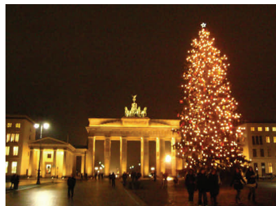
Βερολίνο — Γερμανία : Χριστούγεννα μπροστά στην Πύλη του Βρανδεμβούργου

Αμέσως μετά τα Χριστούγεννα συναντάμε το έθιμο των Τριών Μάγων. Από τις 27 Δεκεμβρίου μέχρι τις 6 Ιανουαρίου παιδικά ντυμένα όπως οι Τρεις Μάγοι πηγαί-