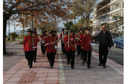
Η μπάντα παίζει χριστουγεννιάτικους ρυθμούς στη Ναύπακτο

εντόσθια και ρύζι που ονομάζεται «ματιά». Την Πρωτοχρονιά, όπως όλοι, κόβουν τη