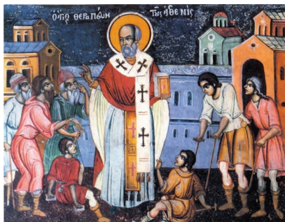
Ο Άγιος Νικόλαος

Ο Άγιος Νικόλαος είναι άγιος της ανατολικής Ορθόδοξης Εκκλησίας αλλά και τη Ρωμαιοκαθολικής. Έζησε τον 4ο αιώνα μ.Χ. στα Μύρα της Λυκίας.