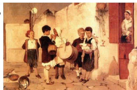
Νικ. Λύτρας : Τα κάλαντα