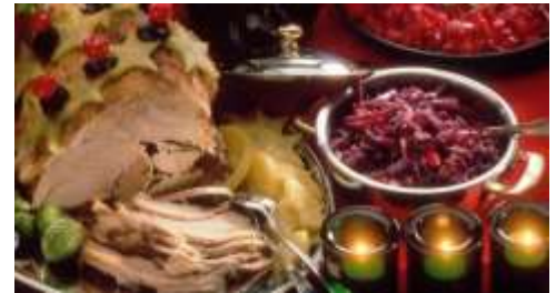
Φινλανδία : Χριστουγεννιάτικα φαγητά

Από τον Μεσαίωνα αυτή γιορτάζεται "Η Διακήρυξη της Ειρήνης των Χριστουγέννων". Η μοναδική χρονιά που δεν γιορτάστηκε ήταν το 1939 εξαιτίας του πολέμου Φινλανδίας και Ρωσίας. Στις μέρες μας διακηρύσσεται