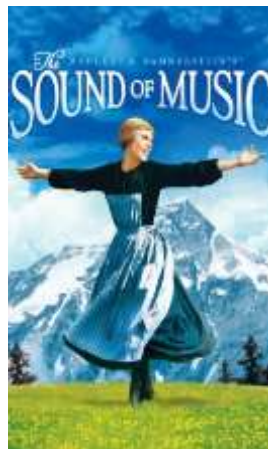
Αφίσα από την ταινία

Πόλεμος, ο Αδόλφος Χίτλερ τους κάλεσε να τραγουδήσουν στα γενέθλιά του. Εκείνοι αρνήθηκαν και με το πατέρα Βάσνερ εγκατέλειψαν την Αυστρία,