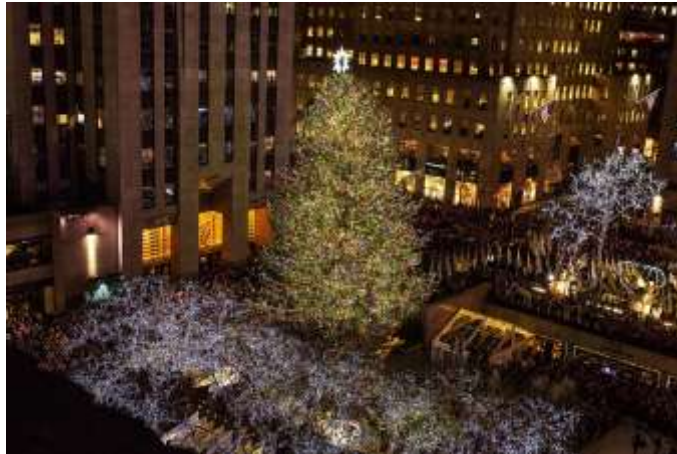
Χριστουγεννιάτικο δέντρο στη Νέα Υόρκη

Ο στολισμός του δένδρου είναι καθαρά συμβολικός της ευτυχίας των ανθρώπων και της φύσεως με τη Γέννηση του Θεανθρώπου. Σύμφωνα με ερευνητές του αντικειμένου, το πρώτο στολισμένο δένδρο εμφανίστηκε στη Γερμανία το 1539 και τα πρώτα στολίδια ήταν συσκευασμένα φαγητά ή είδη ρουχισμού ή άλλα χρήσιμα είδη, που στο πέρασμα των χρόνων και με την άνοδο του βιοτικού επιπέδου εξελί-