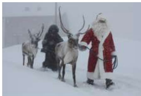
Ελβετία : Samichlaus

Τέσσερις εβδομάδες πριν τα Χριστούγεννα φτιάχνουν το στεφάνι του «advent», που έχει τέσσερα κεριά.