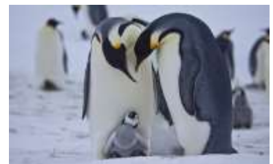
Ανταρκτική : Αυτοκρατορικοί πιγκουίνοι

Επομένως εκεί δε θα συναντήσουμε πολικές αρκούδες. Όμως εκεί ζουν ακάρεα και σιμπούρια διαφόρων ειδών, ο Δομινικανός γλάρος, το περιστέρι της Ανταρκτικής, Πιγκουίνοι, Αυτοκρατορικοί πιγκουίνοι, Άλμπατρος Γλάρος όρθιος, Φρατέρκουλα του Ατλαντικού, θαλάσσιο λιοντάρι της Ανταρκτικής, θαλάσσιος