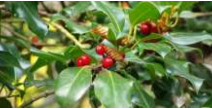
Ίληξ ή Ου

λα, περισσότερο ή λιγότερο οδοντωτά ανάλογα το είδος. Ανθοφορεί την άνοιξη με μικρά αλλά εύοσμα άνθη σε λευκό χρώμα. Στα θηλυκά φυτά τα άνθη ακολουθούνται από σφαιρικούς καρπούς, κόκκινους. Προτιμά τις ηλιόλουστες θέσεις φύτευσης και τα καλά αποστραγγιζόμενα εδάφη. Επίσης, έχει μέτριες απαιτήσεις σε νερό, ενώ παρουσιάζει εξαιρετική αντοχή στις ακραίες