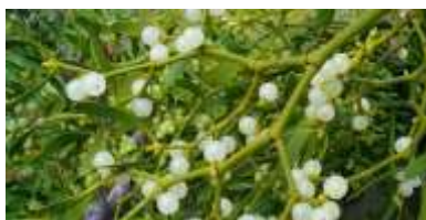
Ιξός ή Γκυ

λα, περισσότερο ή λιγότερο οδοντωτά ανάλογα το είδος. Ανθοφορεί την άνοιξη με μικρά αλλά εύοσμα άνθη σε λευκό χρώμα. Στα θηλυκά φυτά τα άνθη ακολουθούνται από σφαιρικούς καρπούς, κόκκινους. Προτιμά τις ηλιόλουστες θέσεις φύτευσης και τα καλά αποστραγγιζόμενα εδάφη. Επίσης, έχει μέτριες απαιτήσεις σε νερό, ενώ παρουσιάζει εξαιρετική αντοχή στις ακραίες