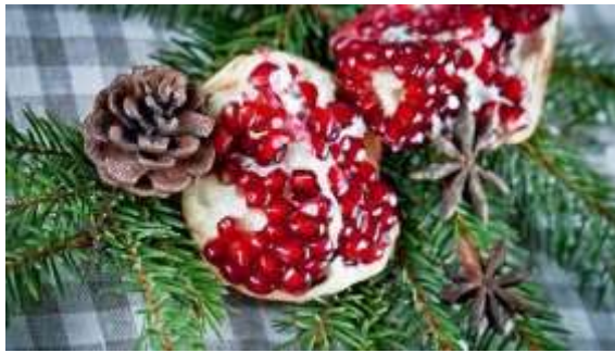
Το σπασμένο ρόδι στην Πελοπόννησο

Το έθιμο λέει πως την ώρα που αλλάζει ο χρόνος, κάποιος πρέπει να πετάξει ένα ρόδι στην εξώπορτα του σπιτιού για να σπάσει. Το ρόδι συμβουλεύει την αφθονία, την καλή τύχη και την γονιμότητα.