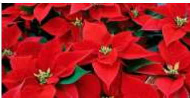
Ποϊνσέπια ή Αλεξανδρινό

Πέρα από το χριστουγεννιάτικο δέντρο τον στολισμό του σπιτιού όμως πλασιώνουν και τα όμορφα φυτά που για μια μικρή περίοδο, αυτή των εορτών γίνονται εσωτερικού χώρου γιατί τον υπόλοιπο καιρό προτιμούν το άπλετο φως του ήλιου και το αερακι που φυσεί τα φύλλα τους στην αυλή μας.