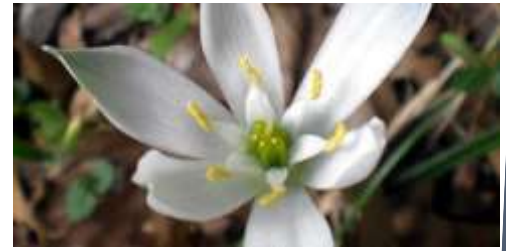
Αστέρι της Βηθλεέμ ή Ορνιθόγαλο

Ιππίαστρο. Έχει μακριά, δερματώδη φύλλα σε έντονο πράσινο χρώμα, επιμήκη και λογχοειδή. Το χαρακτηριστικό, μεγάλου μεγέθους άνθος της φύεται μόνο του ή σε ομάδες έως επτά ανθέων. Έχει μέτριες απαιτήσεις σε νερό ενώ. Η Αμαρυλλίδα προτιμά ηλιόλουστες θέσεις, όπου να δέχεται άμεσο ηλιακό φως για λίγες ώρες. Τα άνθη της είναι μονόχρωμα ή δίχρωμα σε λευκό, κόκκινο, κίτρινο, πορτοκαλί, μωβ ή ροζ χρώμα.