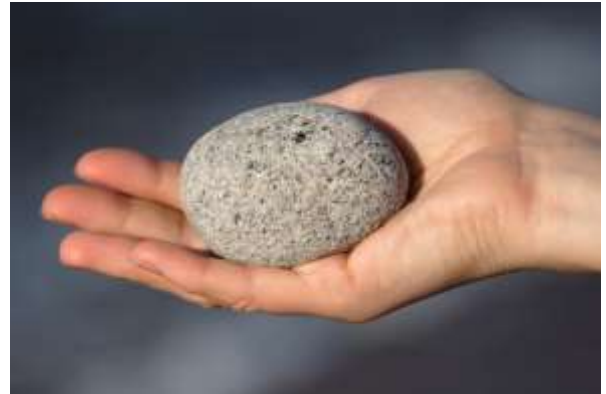
Το έθιμο της πέτρας στην Κρήτη

Ένα από τα παραδοσιακά έθιμα των Χριστουγέννων στη Μεσηνία είναι οι Καλικάντζαροι, γνωστοί ως μαλλιαρά πλάσματα, που τρυπάνουν στα σπίτια τις νύχτες, κλέβουν τα φαγητά που βρίσκουν και