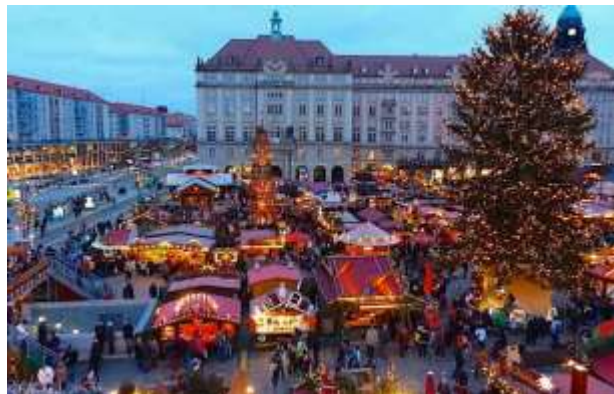
Χριστουγεννιάτικη αγορά στη Γερμανία

Η παραμονή των Χριστουγέννων ή αλλιώς «Noche Buena» είναι το βράδυ