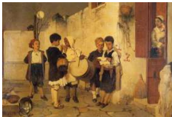
Κάλαντα, Νικηφόρος Λύτρας

α κάλαντα ψάλλονται κυρίως από παιδιά αλλά και από ενήλικα άτομα, είτε μεμονωμένα είτε κατά ομάδες, που περιέρχονται οικίες, καταστήματα, δημόσιους χώρους κ.λπ. με τη συνοδεία του πατροπαράδοτου σιδερένιου τριγώνου, αλλά ενίοτε και άλλων μουσικών οργάνων (φυσαρμόνικας, ακορντεόν, τύμπανου, φλογέρας κ.λπ.). Τα παιδιά ρωτούν συνήθως «Να τα πούμε;» και περιμένουν την απάντηση «Να τα πείτε».