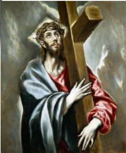
«Ο Χριστός φέρων τον σταυρόν», Ελ Γκρέκο

δυ άπλωναν στο τραπέζι όλα τα εορταστικά φαγητά (το αρνί, πικρίδες, άζυμα και βάμμα). Οι πιο γέροι της οικογένειας διηγούνταν όλη την ιστορία της δουλείας και της απελευθέρωσης από την αιγυπτιακή σκλα-