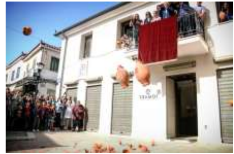
Πρώτη Ανάσταση στην Πρέβεζα

Σκαλισμένη πάνω σε πέτρα σε εμφανές σημείο στο στενό δρομάκι, είναι