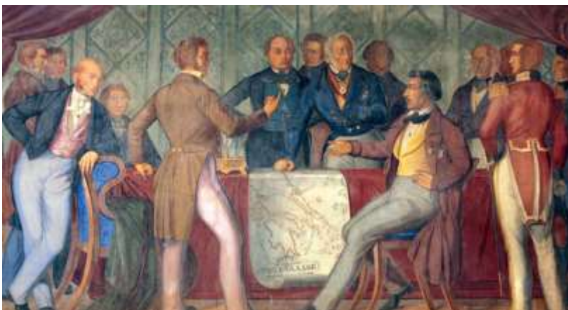
Το Πρωτόκολλο της ανεξαρτησί-