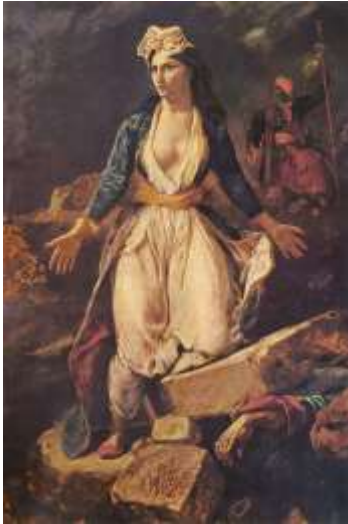
(Συνέ- χεια από τη σελίδα 11)

νταν με φύκια, δέρματα, ποντίκια και γάτες! Το συμβούλιο οπλαρχηγών και προκρίτων στις 6 Απριλίου αποφάσισε έξοδο η οποία ορίστηκε να γίνει τη νύχτα του Σαββάτου του Λαζάρου προς Κυριακή των Βαΐων (9 προς 10 Απριλίου). Όμως, το σχέδιο της εξόδου, είτε προδόθηκε, είτε δεν εφαρμόστηκε σωστά κι έτσι οι δυνάμεις του Ιμπραήμ κατέσφαξαν με τα γιαταγάνια τους μαχητές της ελευθερίας. Σε πολλά σημεία σημειώθηκαν δραματικές σκηνές: ο