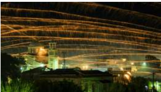
Ρουκετοπόλεμος στη Χίο

Λεωνίδιο : Με το που ακούγεται το πρώτο «Χριστός Ανέστη» πάνω από 500 πολύχρωμα αερόστατα ελευθερώνονται στον ουρανό και τον αναστάσιμο έθιμο, που δεν γίνεται να αφήσει κανέναν ασυγκίνητο. Η πρωτεύουσα της Τσακωνιάς αποτελεί έναν προορισμό που πρέπει να επισκεφτεί κανείς έστω και μία φορά στη ζωή του τις ημέρες του Πάσχα.