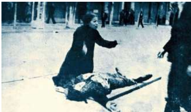
Θεσσαλονίκη 1936—Ο θάνατος του Τάσου Τούση

Στη μνήμη αυτών των νεκρών έχει καθιερωθεί παγκόσμια να τιμάται η μνήμη τους και να προβάλλονται τα