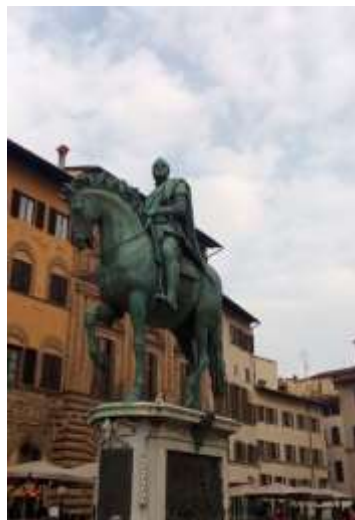
Κόζιμος Α' των Μεδίκων

αυτά έχουν επιγραφές γραμμένες στα αρχαία ελληνικά. Όχι στα λατινικά, στα αρχαία ελληνικά. Ξεχωρί-