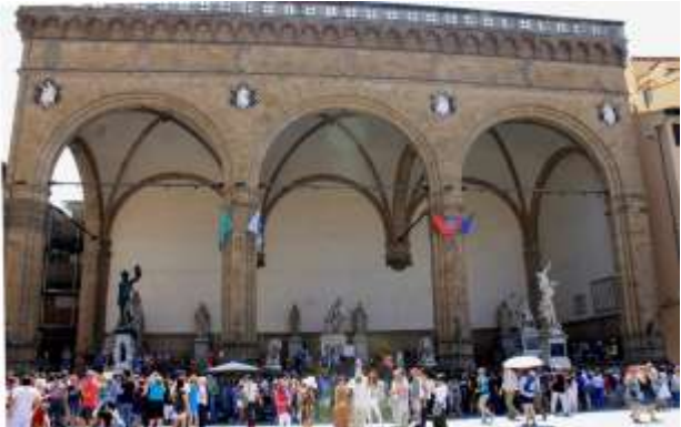
Λότζα Ντελα Σινιορία

Signioria, είναι ένα οικοδόμημα ανοιχτό προς την πλατεία, αλλά στεγασμένο με τριπλή καμάρα, ώστε να προστατεύονται οι επίσημοι από τα καιρικά φαινόμενα κατά τη διάρκεια των πολυάριθμων