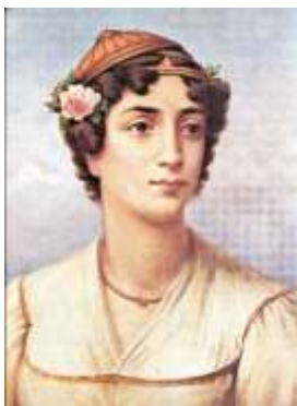
Μαντώ Μαυρογέους :

Κατά την περίοδο της Ελληνικής Επανάστασης σημαντικές φιγούρες ήταν οι Ελληνίδες οι οποίες αγωνίστηκαν για την ελευθέρια και θυσίασαν την ζωή τους ώστε να μην πέσουν στα χέρια του εχθρού. Άλλες γυναίκες που διέθεταν περιουσία την έδωσαν όλη για την ενίσχυση του Αγώνα.