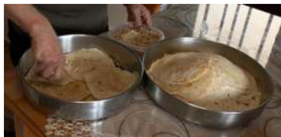
Τα σπάργανα του Χριστού

Τηγανίτες ψημένες πάνω σε πυρωμένη πέτρα και μέσα στο τζάκι, που