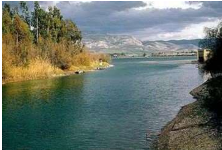
Ο Ιορδάνης ποταμός

Οι καλικάντζαροι αποτελούν μια αρχαία δοξασία «δαιμονίων» που μεταγενέστερα συνδέθηκε με τη χριστιανική παράδοση και θεωρείται ότι εμφανίζονται την περίοδο μεταξύ 25 Δεκεμβρίου έως 6 Ιανουαρίου, κατά την οποία τα «νερά είναι