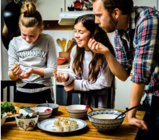
Doppa i grytan

Οι γιορτές στην Σουηδία αρχίζουν στις 13 Δεκεμβρίου με την ημέρα της Lucia (Βασίλισσα του Φωτός),