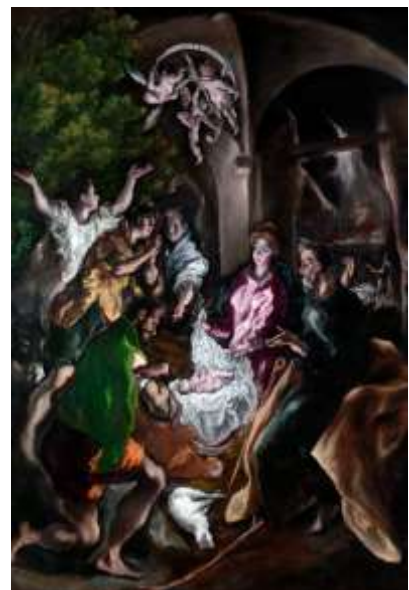
Ελ Γκρέκο : Η προσκύνηση των ποιμένων (1605—1610)