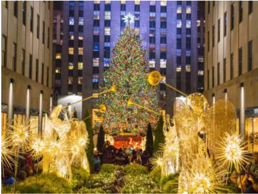
Rockefeller Center Plaza

Η Χριστουγεννιάτικη Νέα Υόρκη είναι μια συναρπαστική εμπειρία από μόνη της και σίγουρα από τα καλύτερα μέρη για να περάσετε τις γιορτές, καθώς διαθέτει εντυπωσιακά γιορτινή ατμόσφαιρα και αξιοθέατα που δε θα βρείτε πουθενά αλλού. Δείτε όμως και τι θα πρέπει να