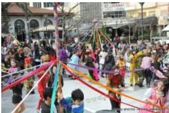
Λιβαδειά : Γαϊτανάκι

Το Γαϊτανάκι αποτελεί παράδοση για την πόλη της Λιβαδειάς και γιορτάζεται την τελευταία Κυριακή