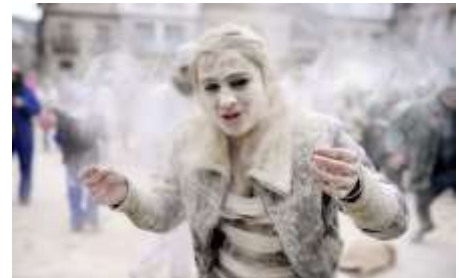
Γαλαξίδι : Αλευροπόλεμος

Όταν ανοίξει το Τριώδιο, όλοι σχεδόν οι κάτοικοι του Γαλαξιδίου κυκλοφορούν μεταμφιεσμένοι με αποκριάτικα κοστούμια στους δρόμους