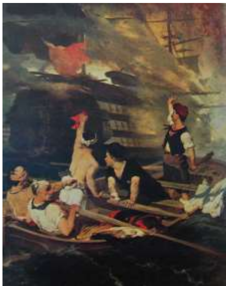
Νικηφόρος Λύτρας : Η πυρπόληση της τουρκικής φρεγάτας από τον Κανάρη