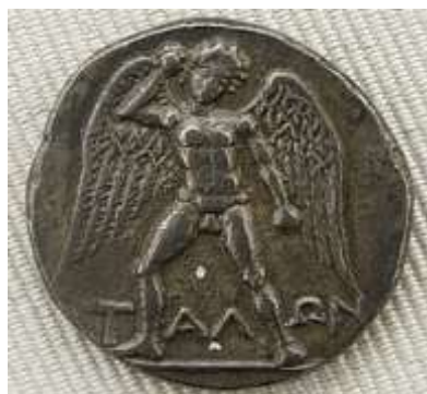
Δίδραχμο της Φαιστού με τον Τάλω