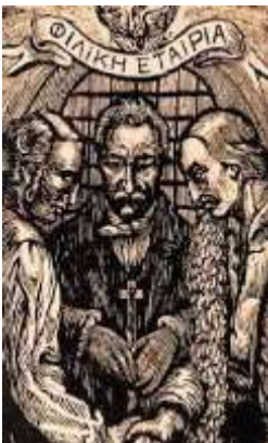
Η ίδρυση της Φιλικής Εταιρείας (1814)

Πολλές εξεγέρσεις είχαν λάβει χώρα κατά τη διάρκεια της Οθωμανικής