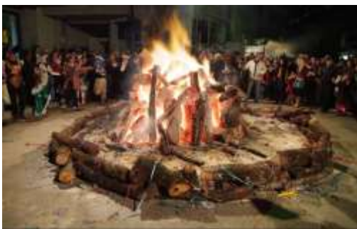
Ιωάννινα : Τζαμάλες

κάνουν παρέλαση στον κεντρικό δρόμο της πόλης, ντυμένες με αποκριάτικες στολές, για να καταλήξουν σε κάποιο από τα κέντρα της πόλης για ξεφάντωμα.