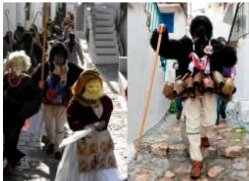
Σκύρος : Γέρος και Κορέλα

Ο «γέρος» φοράει χοντρή μαύρη κάπα, άσπρη υφαντή βράκα και έχει στη μέση του 2 - 3 σειρές κουδούνια, το