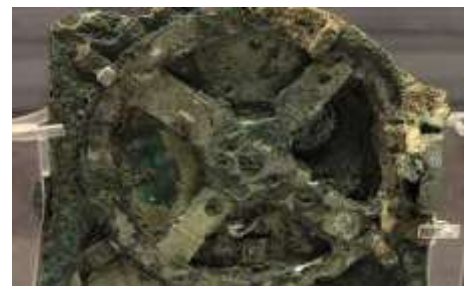
Ο μηχανισμός των Αντικυθήρων

σιού Αντικύθηρα μεταξύ των Κυθήρων και της Κρήτης. Με βάση τη μορφή των ελληνικών επιγραφών που φέρει, χρονολογείται μεταξύ του 150 π.Χ. και του 100 π.Χ., αρκετά πριν από την ημερομηνία του ναυαγίου, το οποίο ενδέχεται να συνέβη ανάμεσα στο 87 π.Χ. και 63 π.Χ. Θα μπορούσε να ήταν κατασκευασμένο μέχρι μισό αιώνα πριν το ναυάγιο. Το ναυάγιο ανακαλύφθηκε το 1900 σε βάθος περίπου 40 με 64 μέτρων και πολλοί θησαυροί, αγάλματα και άλλα αντικείμενα, ανασύρθη-