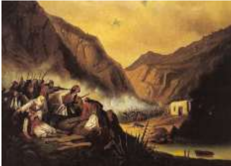
Θ. Βρυζάκης : Η μάχη στα Δερβενάκια

Τον Απρίλιο του 1822 ήρθε το πρώτο πραγματικά τραγικό γεγονός, η Σφαγή της Χίου . Αιτία στάθηκε η εξέγερση του νησιού και η αντίδραση των Τούρκων ήταν κτηνώδης, κατέσφαξαν τον πληθυσμό και όσους υποδούλωσαν τους πούλησαν για σκλάβους. Την εκδίκηση ανέλαβε να πάρει ο Κωνσταντίνος Κανάρης ο οποίος με ένα σκάφος πυρπόλησε την φρεγάτα του αρχηγού των Τουρκικών δυνάμεων. Τον επόμενο μήνα (Ιούλιο 1822) ο σουλτάνος έστειλε στην Πελοπόννησο