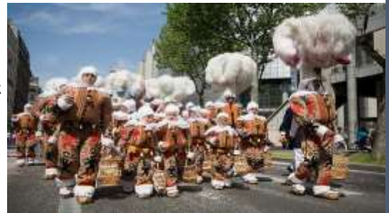
Καρναβάλι στη Μπινς (Βέλγιο)