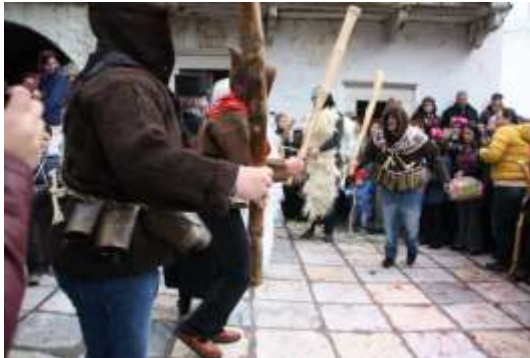
Νάξος : Κουδουνάτοι

και κουκούλα, γυρνούν το χωριό και προκαλούν με άσεμνες εκφράσεις. Οι ίδιοι κρατούν «σόμπα», ξύλο που παραλληλίζεται με τον διονυσιακό φαλλό. Μαζί τους μπλέκονται ο «Γέρος», η «Γριά» και η «Αρκούδα». Στις αποκριτικές εκδηλώσεις των «Κουδουνάτων» μπορεί κανείς να δει τον «γάμο της