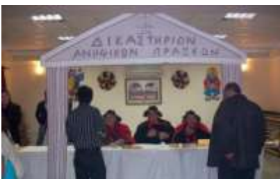
Δικαστήριο Ανήθικων Πράξεων στην Κάρπαθο

Την Καθαρά Δευτέρα λειτουργεί το Λαϊκό Δικαστήριο Ανήθικων Πράξεων. Κάποιοι κάνουν άσχημες χειρονομίες