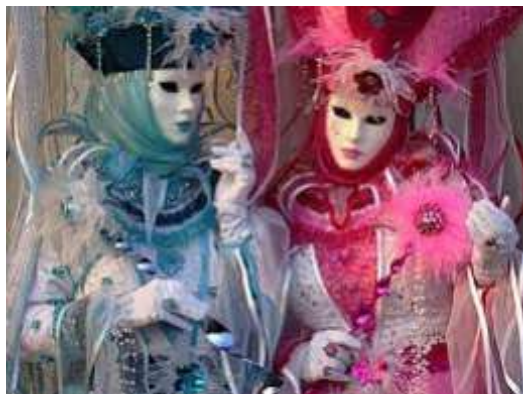
Βενετία : Αποκριάτικες Μάσκες

που έχουν δημιουργηθεί. Προσωπίδες λατρείας που καλόπιαναν τα κακά πνεύματα, πολεμικές που τρομοκρα-