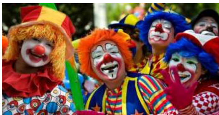
Πάτρα : Καρναβαλιστές

Γίνεται αναπαράσταση του Βλάχικου Γάμου και η γαμήλια πομπή θα ξεκινάει από τα γραφεία του συλλόγου με παραδοσιακή μουσική. Όσοι συμμετέ-