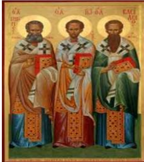
Οι Τρεις Ιεράρχες

πολίτης. Η μνήμη των Τριών Ιεραρχών έρχεται να συμβολίσει μεταφορικά την