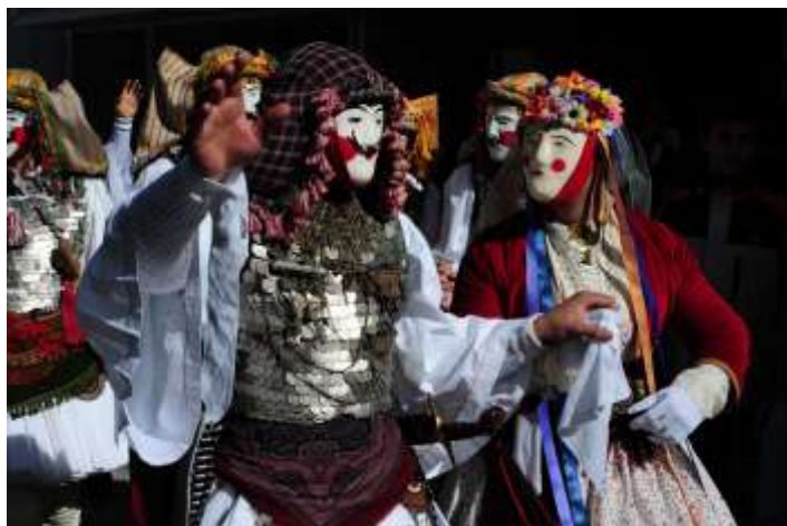
Νάουσα : Γενίτσαροι και Μπούλες

Η μάσκα του Γενίτσαρου την περίοδο της αποκριάς στολίζει πολλά μπολκόνια της Νάουσας. Χαρακτηριστικός είναι ο χαιρετισμός των Γενίτσαρων, ο