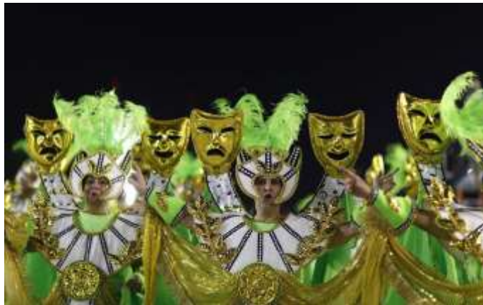
Καρναβάλι Ρίο ντε Τζανέιρο

Όταν η χώρα κέρδισε την ανεξαρτησία της, οι cariocas (έτσι λέγονται οι κάτοικοι του Ρίο) αποφάσισαν να διαφοροποιήσουν το καρναβάλι τους από αυτό της Πορτογαλίας και να εισάγουν ντόπια στοιχεία, όπως την αφρικάνικη μουσική, τις παραδόσεις των αυτοχθόνων ινδιάνων. Επίσης λέγεται ότι είχαν σαν πρότυπο το παριζιάνικο καρναβάλι. Το πιο σημαντικό στοιχείο των φανταχτερών καρναβαλικών παρελάσεων τους είναι η συμμετοχή των «escolas de samba», δηλαδή οι σχολές σάμπα. Αυτές οι σχολές είναι πολύ δημοφιλείς