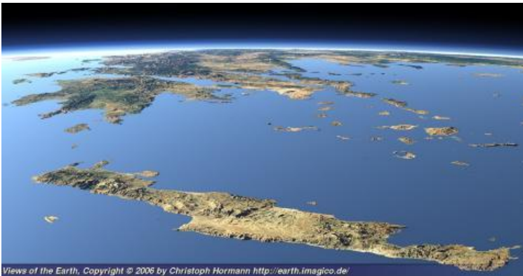
Views of the Earth.

το στόλισμα του χριστουγεννιάτικου δέντρου και η γαλοπούλα στο χριστουγεννιάτικο τραπέζι.