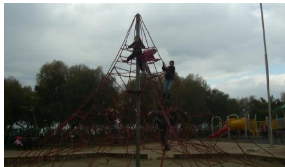
Παιχνίδια στο «Πάρκο Φλοΐβου»

Στη συνέχεια και αφού περιηγήθηκαμε στην έκθεση ζωγραφικής που φιλοξενούνταν στο Φλοίσβο, ανεβήκαμε με τον κ. Δήμαρχο στον επάνω όροφο απ' όπου θαυμάσαμε τη θάλασσα που απλώνονταν μπροστά μας, καθώς επίσης και την πόλη του Π. Φαλήρου την οποία ακολουθούσε από κοντά η Λεωφόρος Ποσειδώνος, ενώ από την άλλη μεριά ξεκινούσε το πάρκο Φλοίσβου, που ήταν και ο επόμενος σταθμός μας.