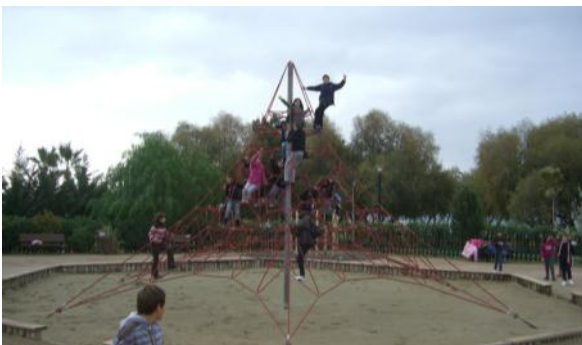
Παιχνίδια στο «Πάρκο Φλοΐβου»

Εδώ ευχαριστήσαμε τον κ. Δήμαρχο και συνεχίσαμε την περιήγησή μας.