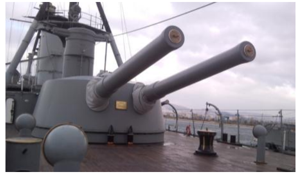
Το θωρηκτό «Αβέρωφ», ζωντανό κομμάτι της νεότερης ιστορίας μας