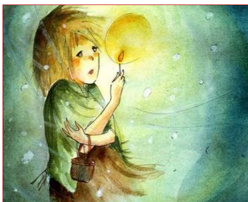
Τότε άναψε ένα σπέρτο...

σπιτιού τους. Περνώντας μια άμαξα την τρόμαξε, της έπεσαν τα σπέρτα και της έφυγε το τσόκαρο. Προσπάθησε να μαζέψει τα σπέρτα, αλλά ένα αγοράκι της πήρε το τσόκαρο. Πεινασμένη, ξυπόλητη και εξασθεωμένη προχωρούσε