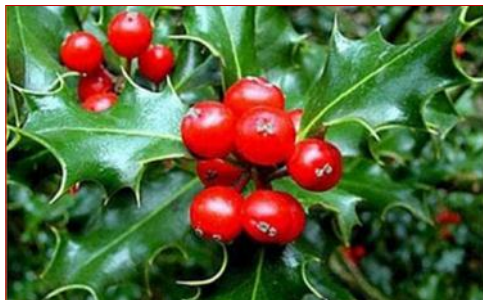
Ίλεξ (αρκουδοπούρναρο ή ου)

Για πολλούς ίσως το σημαντικότερο χριστουγεννιάτικο φυτό. Καθαρά εξωτερικού χώρου φυτό. Σε περίπτωση που βάλετε φυσικό δέντρο για να το