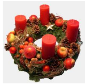
ΠΑΝΤΟΓΝΩΣΤΕΣ — Ελίνα Καβαλάκη

έκπληξη τα παιδιά επιστρέφοντας από την εκκλησία. Ύστερα, η οικογένεια γιορτάζει τα Χριστούγεννα πάνω απ' το πλούσιο τραπέζι, ενώ τη δεύτερη μέρα μαζεύονται όλοι οι συγγενείς και γιορτάζουν όλο το απόγευμα. Ένα έχω να πω : Οι Γερμανοί ξέρουν να γιορτάζουν τα Χριστούγεννα και τα κάνουν μαγικά!