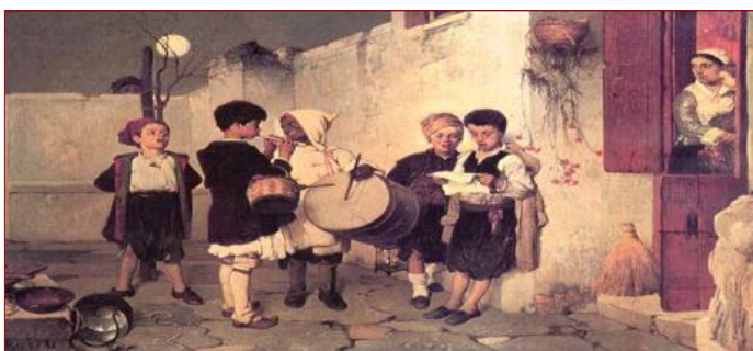
Νικηφόρος Λύτρας : Τα κάλαντα

Τα παραδοσιακά γλυκά των γιορτών είναι τα μελομακάρονα οι κουραμπιέδες, τα σαρίκια, οι λουκουμάδες, οι γλυκοκουλούρες, η Βασιλόπιτα. Τα μελομακάρονα βουτιούνται σε μέλι και πασπαλίζονται με κοπανισμένο καρύδι, σιγάμι και κανέλα. Οι κουραμπιέδες έχουν αγνό βούτυρο, ρακί, αμύγδαλα, ζάχαρη άχνη. Η ζάχαρη συμβολίζει τα χιονισμέ-