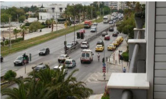
Ο Φλοίσβος και η Λεωφόρος Ποσειδώνος

Δήμαρχος:- Τη νοοτροπία των κατοίκων , να αγαπούν περισσότερο την πόλη τους και να δίνουν και ένα καλό παράδειγμα Π.χ. να πετάνε τα σκουπίδια τους στον σκουπίδοτενεκέ , να μην παρκάρουν εκεί που είναι διαβάσεις πεζών και να σέβονται περισσότερο ο