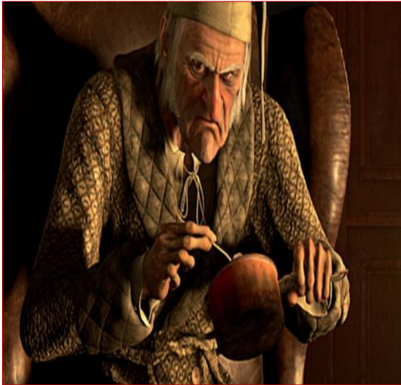
Ο Εμπενίζερ Σκρουτζ

Κάποια στιγμή όμως, ο Μάρλεϊ πέθανε, κι έτσι ο