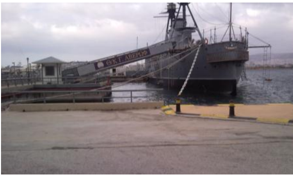
Το θωρηκτό «Αβέρωφ»