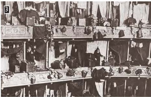
3 ▲ Τους πρώτες μήνες οι πρόσφυγες εγκαταστάθηκαν ακόμη και σε θέατρα