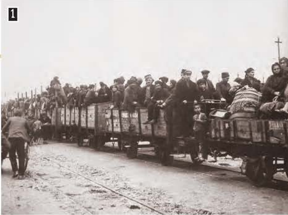
1 ▲ Έλληνες πρόσφυγες φτάνουν στην ηπειρωτική Ελλάδα