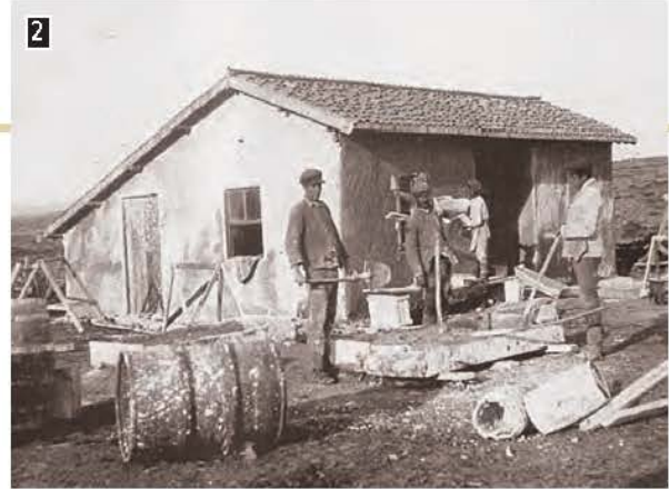
2 ▲ Τυπική προσφυγική κατοικία