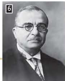
6 ▲ Ο Ιωάννης Μεταξάς (1871-1941)