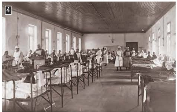
4 ▲ Νοσοκομείο προσφύγων