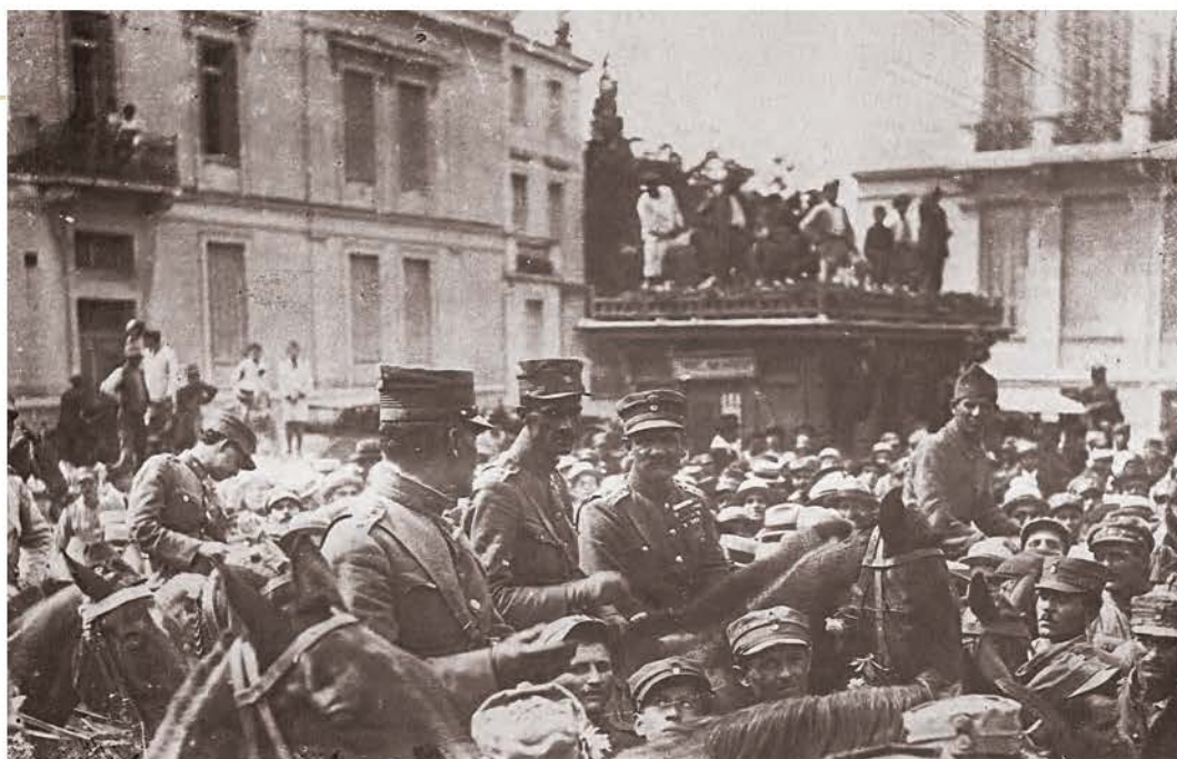
▲ Σεπτέμβριος του 1922. Τμήματα του ελληνικού στρατού εισέρχονται στην Αθήνα

Μετά τη Μικρασιατική Καταστροφή, περισσότεροι από ένα εκατομμύριο πρόσφυγες έφτασαν στην Ελλάδα. Η ανακούφιση και η εγκατάστασή τους ήταν το μεγαλύτερο πρόβλημα που αντιμετώπισε η χώρα την περίοδο του Μεσοπολέμου. Ταυτόχρονα, την ίδια περίοδο στην Ελλάδα επικρατούσε πολιτική και κοινωνική αναταραχή.