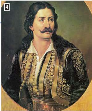
4 ▲ Ο Αθανάσιος Μασαβέτας, που έμεινε γνωστός ως Αθανάσιος Διάκος επειδή είχε χειροτονηθεί Διάκονος