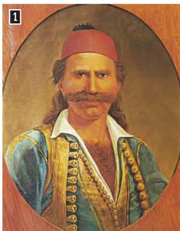
▲ Ο Οδυσσέας Ανδρούτσος