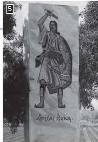
5 ▲ Το μνημείο του Διάκου στη γέφυρα της Αλθαμάνας, όπου συνβλήστηκε από τους Τούρκους