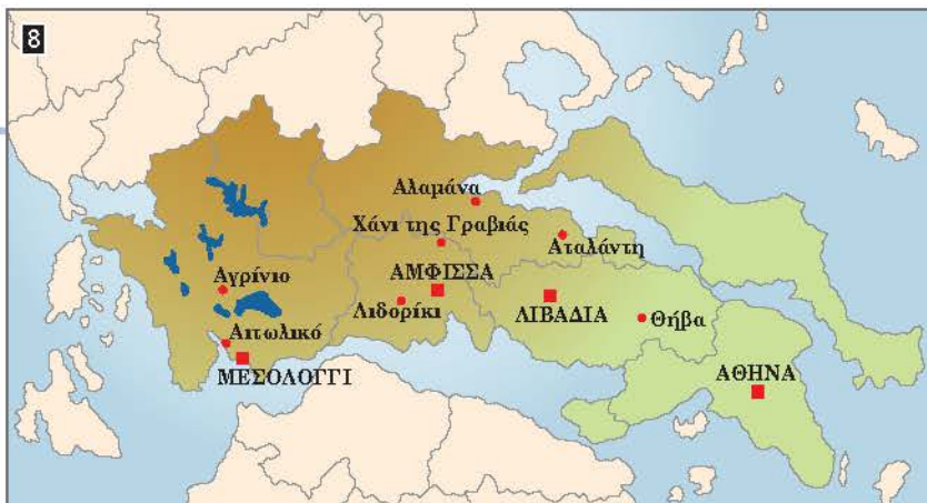
8 ◀ Οι επαναστατικές εστίες στη Στερεά Ελλάδα