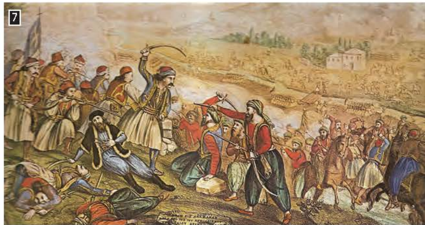
7 ◀ Αλέξανδρος Ησάης, ζωγραφική απεικόνιση της μάχης της Αλθαμάνας, Αθήνα, Εθνικό Ιστορικό Μουσείο