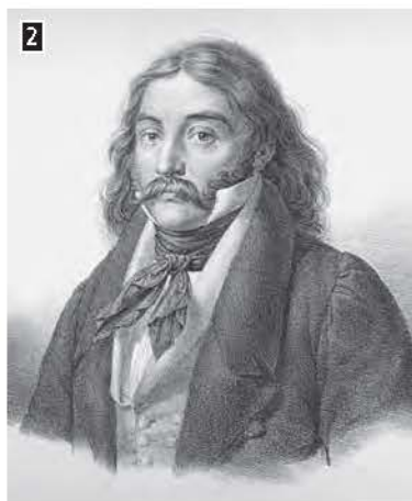
▲ Ο Αλέξανδρος Μαυροκορδάτος