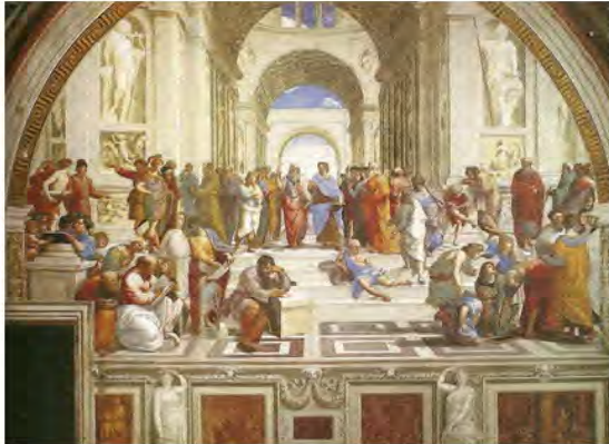
Ραφαήλ, Η Σχολή των Αθηνών