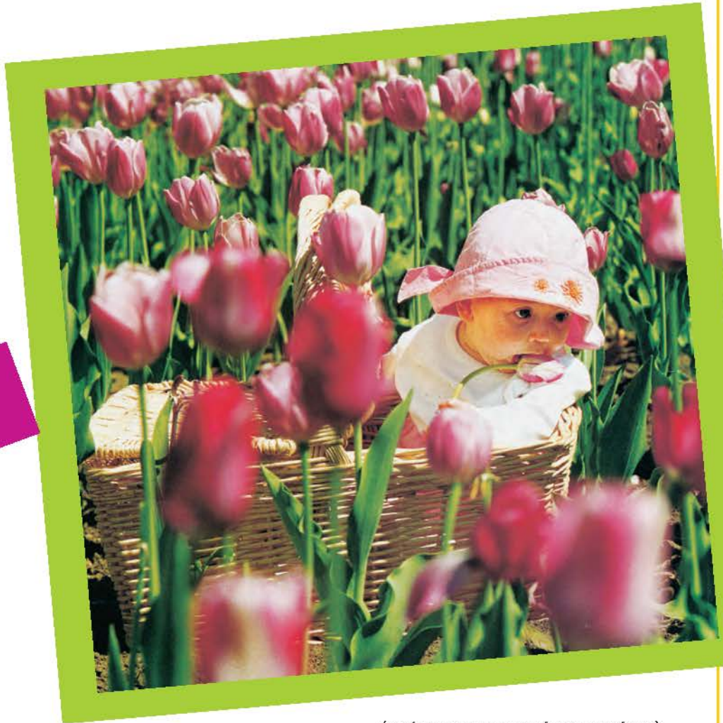
(αφίσα για τη γιορτή της μητέρας)