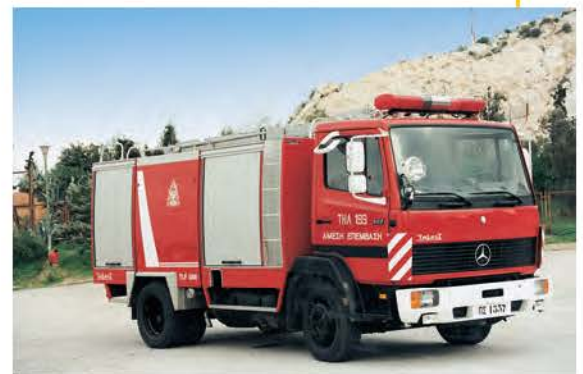
Έρχεται η Πυροσβεστική!

Οι πυροσβέστες ξεδίπλωσαν γρήγορα γρήγορα κάτι τεράστιους πάνινους σωλήνες νερού που είχαν μαζί τους στο αυτοκίνητο. Μετά άνοιξαν τους μεγάλους διακόπτες του νερού που υπήρχαν στο κόκκινο αυτοκίνητό τους και βάλθηκαν να ρίχνουν νερό πάνω