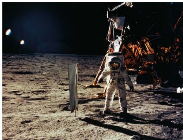
Εικόνα 6.4: Οι πρώτοι άνθρωποι στη Σελήνη

Μία από τις μεγάλες στιγμές της ανθρωπότητας ήταν εκείνη που οι αστροναύτες Άρμτρονγκ και Ώλντριν περπάτησαν στο έδαφος της Σελήνης στις 21 Ιουλίου 1969. Στο σημείο που πάτησαν για πρώτη φορά έστησαν μια πινακίδα που έγραφε: «ΕΡΧΟΜΑΣΤΕ ΕΙΡΗΝΙΚΑ ΕΚ ΜΕΡΟΥΣ ΤΗΣ ΑΝΘΡΩΠΟΤΗΤΑΣ».