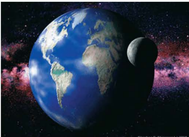
Εικόνα 6.3: Η Γη και ο δορυφόρος της

Ας συζητήσουμε γιατί όλοι οι πλανήτες του ηλιακού μας συστήματος έχουν αρχαία ελληνικά ονόματα.