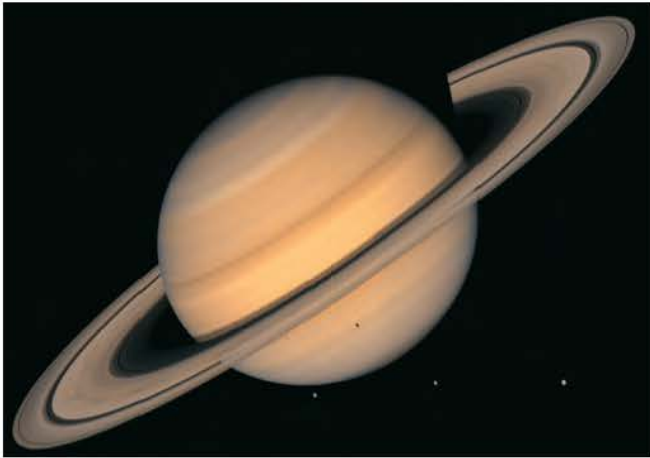
Εικόνα 6.2: Ο Κρόνος

Χρησιμοποιώντας τα στοιχεία του πίνακα της προηγούμενης σελίδας βρείτε τα ουράνια σώματα που έχουν μεγαλύτερο μέγεθος από το μέγεθος της Γης.