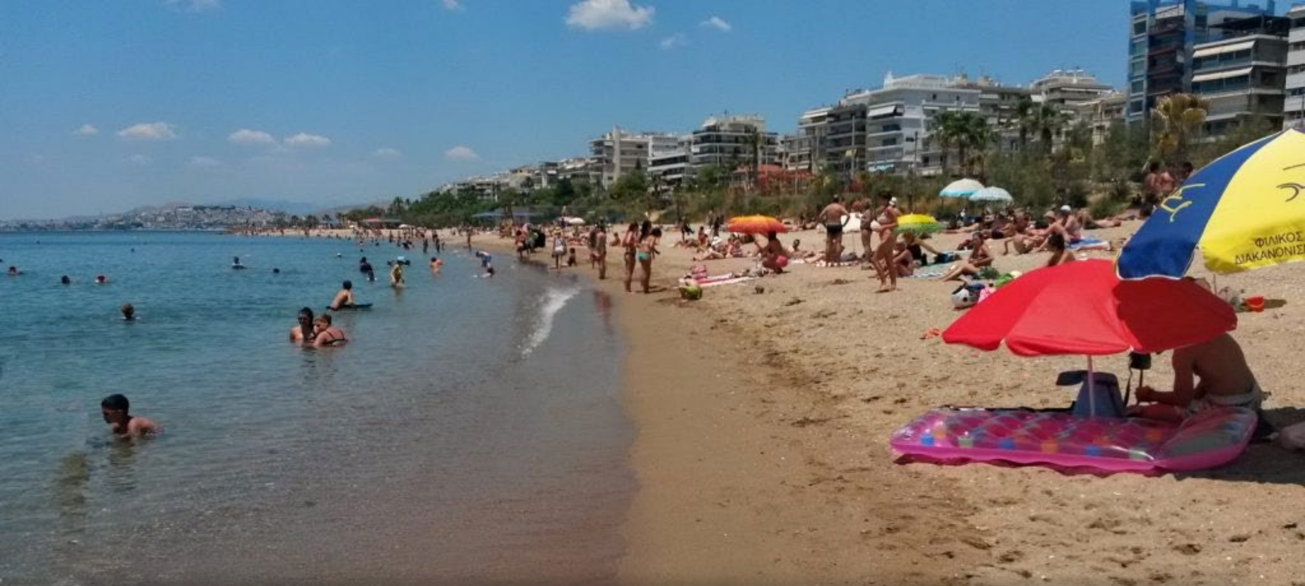
Η παραλία του Μπάτη