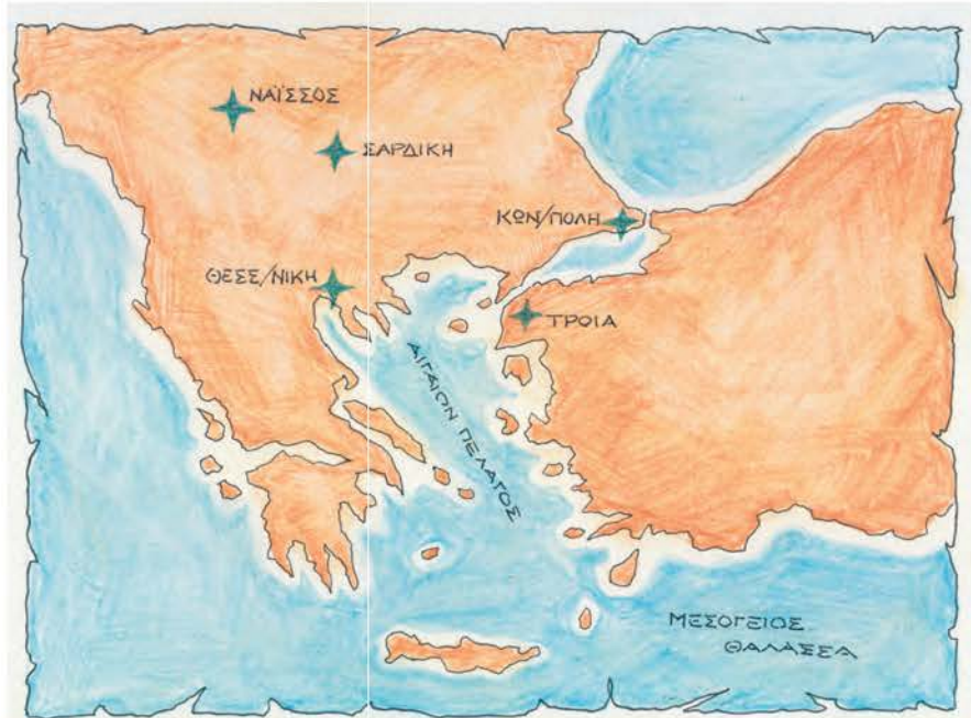
1. Χάρτης με τις πόλεις που ο Κωνσταντίνος είχε διαλέξει για να μεταφέρει την πρωτεύουσα της Ρωμαϊκής Αυτοκρατορίας.

Στα χρόνια παρακμής της αυτοκρατορίας (13ος