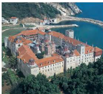
6.α. Άγιο Όρος, Ιερά Μονή Εσφιγμένου.

Στη διάρκεια της εικονομαχίας πολλοί διωκόμενοι εικονολάτρες κατέφυγαν στο όρος Άθως της Χαλκιδικής, παίρνοντας μαζί τους ιερά λείψανα, εικόνες, χειρόγραφα και σκεύη των εκκλησιών, για να τα περισώσουν. Εκεί, αρχικά, ζούσαν σε σπηλιές και σε σκήτες 3 «μελετώντας και διαλογιζόμενοι».