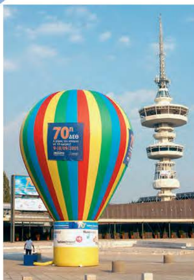
5.α. Η Θεσσαλονίκη τις μέρες της Διεθνούς Έκθεσης.