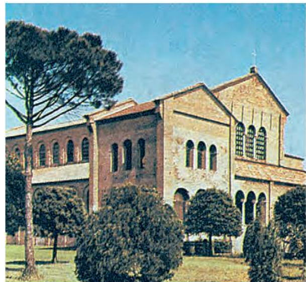
2. Ο ναός του Αγίου Δημητρίου στη Θεσσαλονίκη.