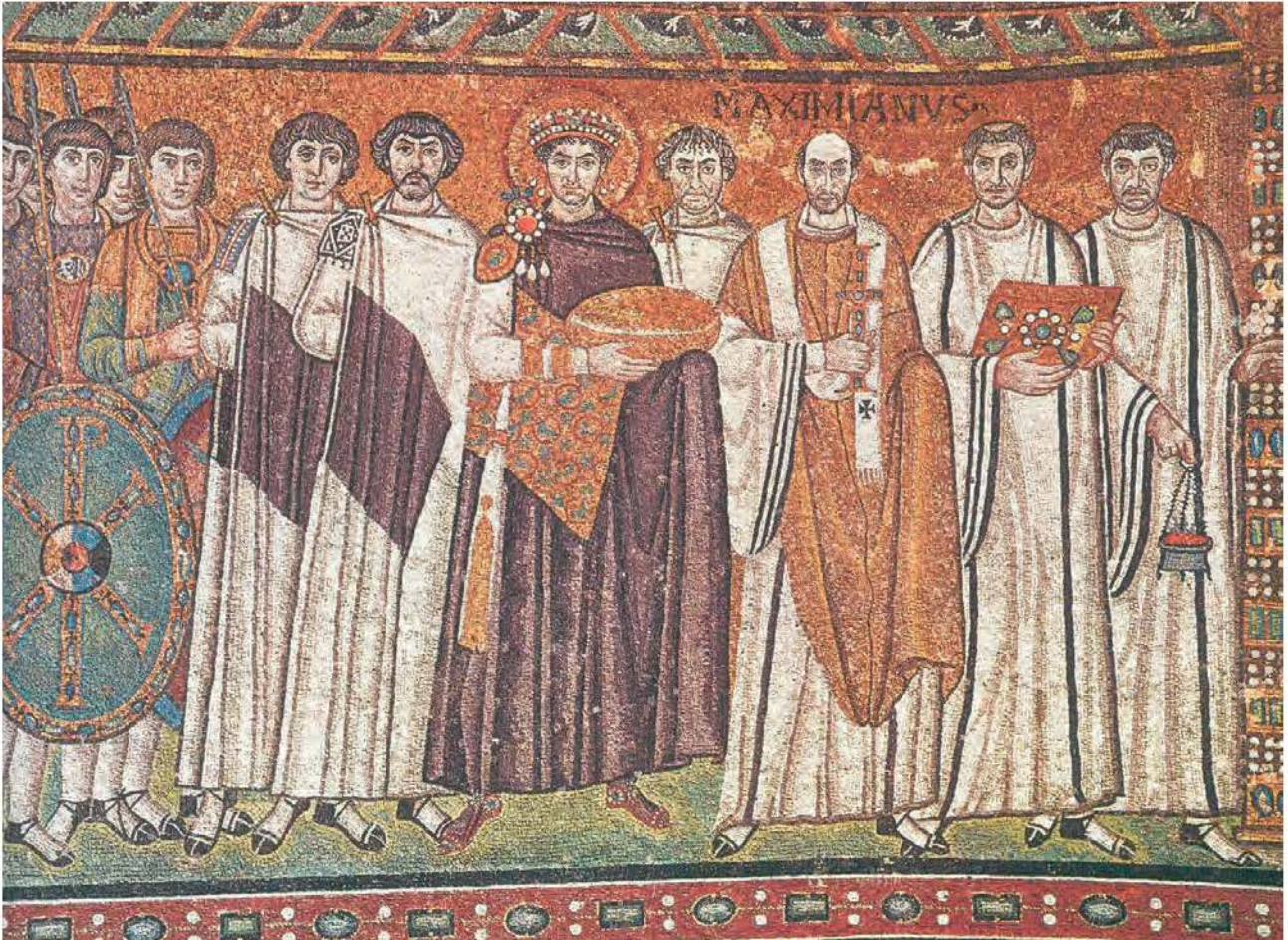
5. Ο Ιουστινιανός, ο επίσκοπος Ραβέννας Μαξιμιανός και αξιωματούχοι. (Ψηφιδωτό από τον ναό του Αγίου Βιταλίου στη Ραβέννα, που έγινε μετά την απελευθέρωση της πόλης από τους Βυζαντινούς)