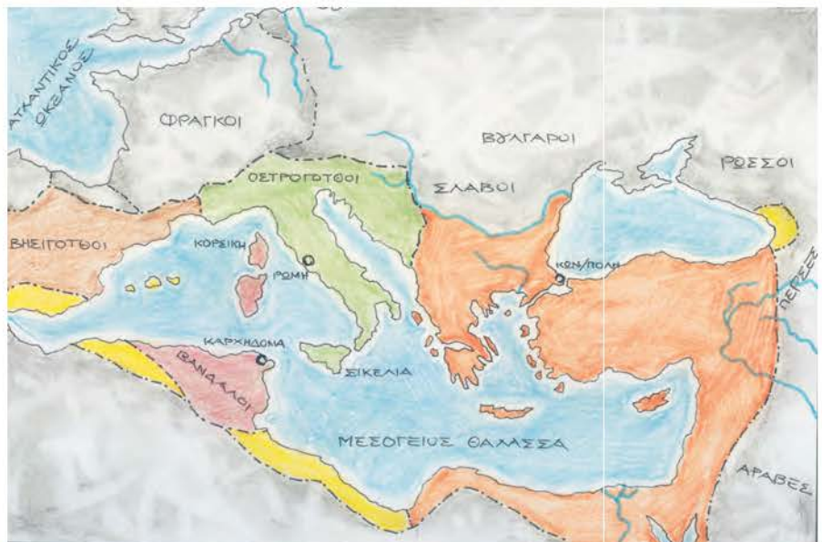
2. Χάρτης της αυτοκρατορίας πριν από τους πολέμους του Ιουστινιανού.