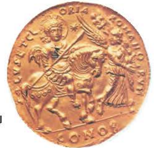
1. Βυζαντινό χρυσό μετάλλιο. Ο έφιππος Ιουστινιανός με στρατιωτική στολή ακολουθεί τη Νίκη, που κρατά δάφνη. (Αθήνα, Νομισματικό Μουσείο)