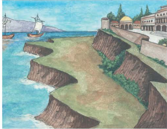
1. Το Παλάτι ήταν χτισμένο στην πλευρά ενός λόφου, πάνω από τον Βόσπορο και την Προπονίδα.

Προέκταση των χώρων του παλατιού και φυσική συνέχειά του ήταν ο ιππόδρομος . Ως πρότυπό του είχε το Κολοσσαίο της Ρώμης, αλλά ήταν προσαρμοσμένος στον χώρο του παλατιού και της νέας πρωτεύουσας. Στις μαρμάρινες κερκίδες 3 του κάθονταν χιλιάδες θεατές, αρκετές φορές τον χρόνο, για να χαρούν τις ιπποδρομίες, τους αγώνες και τις άλλες εκδηλώσεις που γίνονταν εκεί. Οι ιπποδρομίες γίνονταν σε καθορισμένες ημερομηνίες και τις παρακολουθούσε συχνά και ο αυτοκράτορας από το ειδικό θεωρείο του. Ιπποδρομίες γίνονταν, με άδεια του παλατιού, και σε κάποιες έκτακτες περιπτώσεις για να γιορταστούν ευχάριστα γεγονότα ή για να τιμηθούν ξένοι άρχοντες ή πρεσβείες που επισκέπτονταν την Πόλη. Στη διάρκεια των ιπποδρομιών οι θεατές επευφημούσαν τον αυτοκράτορα και συχνά εξέφραζαν σ' αυτόν τα αιτήματα ή και τα παράπονά τους.