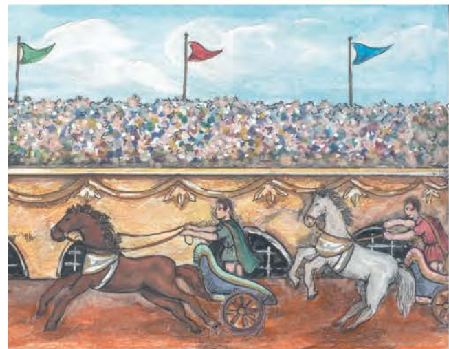
2. Οι ιπποδρομίες ήταν το αγαπημένο αγώνισμα των Βυζαντινών.