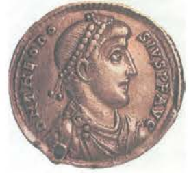
3. Ο Θεοδόσιος Α' σε νόμισμα της εποχής.

Για όλα αυτά οι χριστιανοί ονόμασαν τον Θεοδόσιο «Μέγα» και τον Ιουλιανό «Παραβάτη» ή «Αποστάτη». Ο χριστιανισμός όμως τελικά επιβλήθηκε με τη διδασκαλία του και το έργο των πατέρων της εκκλησίας. Ιδιαίτερη συμβολή στην ειρηνική εξάπλωση του χριστιανισμού είχαν οι τρεις ιεράρχες, Μέγας Βασίλειος, Γρηγόριος ο Ναζιανζηνός και Ιωάννης ο Χρυσόστομος , οι οποίοι συνδύασαν την αρχαία ελληνική παιδεία με τα διδάγματα της νέας θρησκείας.