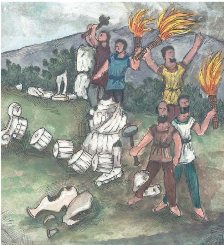
4. Φανατικοί χριστιανοί καταστρέφουν αρχαία μνημεία.