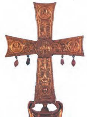
1. Ο σταυρός ήταν σύμβολο της θρησκείας και του κράτους. (Μουσείο Βατικανού)

Την ίδια θετική στάση για τους Χριστιανούς τήρησε και ο γιος του Κωνσταντίνου, που τον διαδέχθηκε.