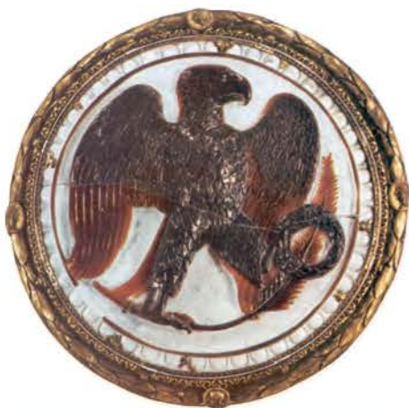
1. Ο αετός ήταν το σύμβολο της δύναμης του Ρωμαίου αυτοκράτορα.

Μέσα στο απέραντο ρωμαϊκό κράτος κατοικούσαν άνθρωποι από πολλές φυλές, με διαφορετικές γλώσσες, θρησκείες και συνήθειες. Ήταν μια πολυπολιτισμική αυτοκρατορία 2 . Κι όλοι αυτοί έπρεπε να κυβερνηθούν από τη Ρώμη! Οι Ρωμαίοι, για να λύσουν τα προβλήματα διοίκησης που γεννούσε η απέραντη αυτοκρατορία τους: