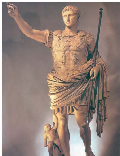
3. Ανδριάντας του αυτοκράτορα Αυγούστου. (Μουσείο Βατικανού) Οι Ρωμαίοι σέβονταν τον αυτοκράτορα τόσο που τον λάτρευαν ως θεό.

Όλα αυτά τα μέτρα βοήθησαν να επικρατήσει τάξη, ασφάλεια και δικαιοσύνη στην αυτοκρατορία, για διακόσια περίπου χρόνια. Στο διάστημα αυτό αναπτύχθηκαν η γεωργία, το εμπόριο, η ναυτιλία και η βιοτεχνία. Ήταν η περίοδος της « ρωμαϊκής ειρήνης » (pax romana), όπως ονομάστηκε.