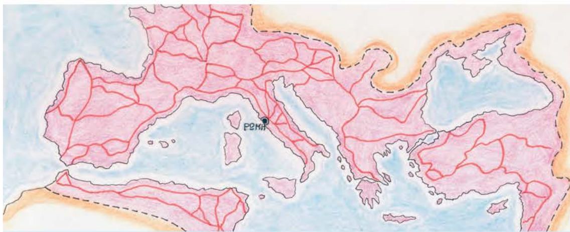
4.1. Οι ρωμαϊκοί δρόμοι.

Στα χρόνια ακμής του ρωμαϊκού κράτους κατασκευάστηκε ένα πυκνό δίκτυο δρόμων, που ένωσε την πρωτεύουσα με όλες τις περιοχές της αυτοκρατορίας, τις μεγάλες πόλεις και τα λιμάνια. Ένας από αυτούς ήταν η Εγνατία Οδός. Ξεκινούσε από το Δυρράχιο, περνούσε από τη Βέροια, την Πέλλα και τη Θεσσαλονίκη και κατέληγε στο Βυζάντιο. Τους δρόμους αυτούς χρησιμοποιούσαν κυρίως ο στρατός, οι έμποροι και οι αγγελιοφόροι.