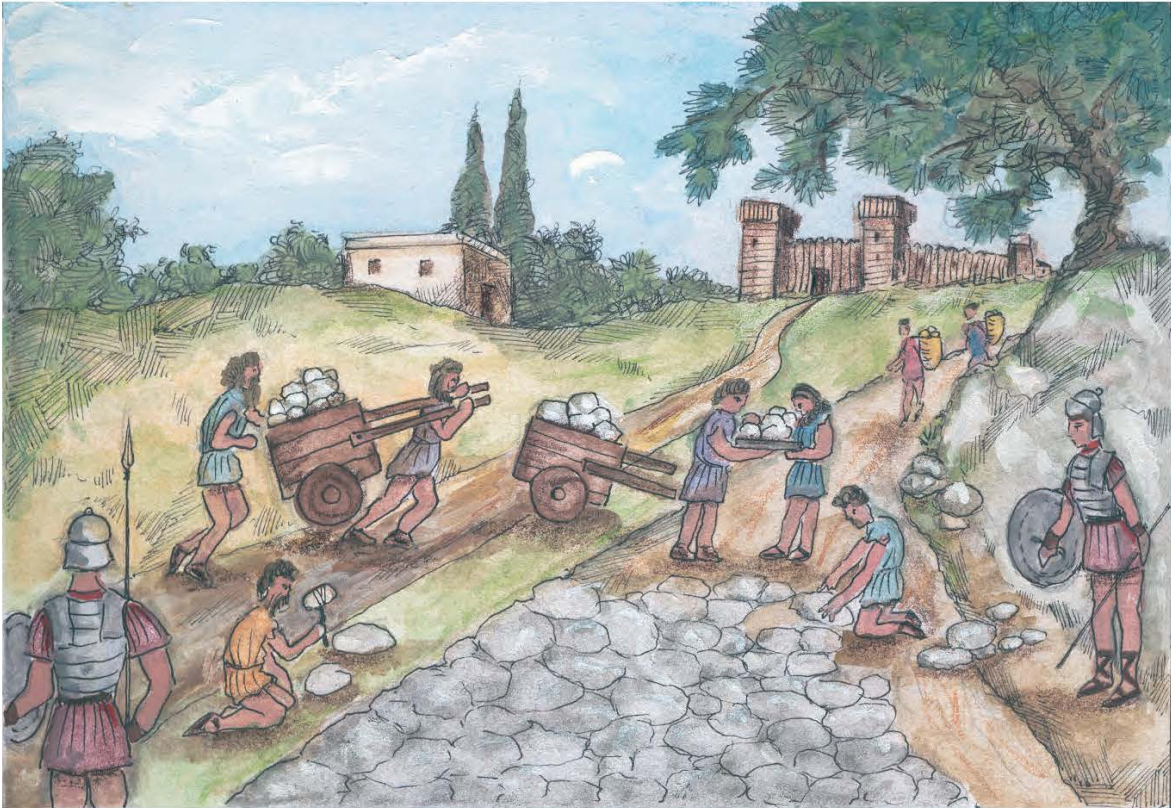
5. Σε περιόδους ειρήνης ο ρωμαϊκός στρατός εργαζόταν και βοηθούσε να κατασκευαστούν δρόμοι, γέφυρες, λιμάνια και αρδευτικά έργα.