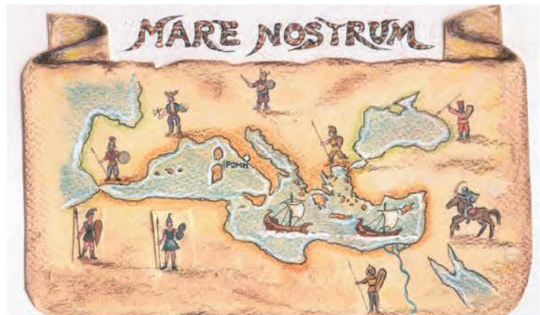
2. «Οι Ρωμαίοι δεν υπέταξαν μόνο κάποια μέρη, αλλά ολόκληρη την οικουμένη. Απλώνονται σε μια έκταση, που ξεπερνά όλα τα κράτη και έτσι δεν φοβούνται κάποιο μελλοντικό ανταγωνισμό». Πολύβιος, Ιστορία .