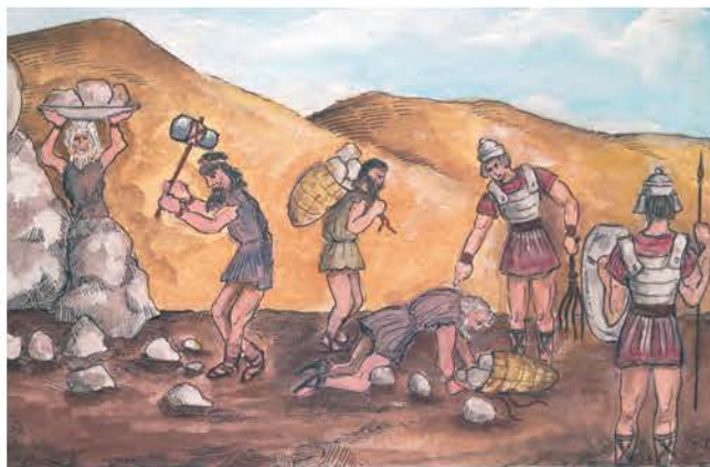
2. Αιχμάλωτοι Έλληνες δουλεύουν στους ρωμαϊκούς δρόμους.