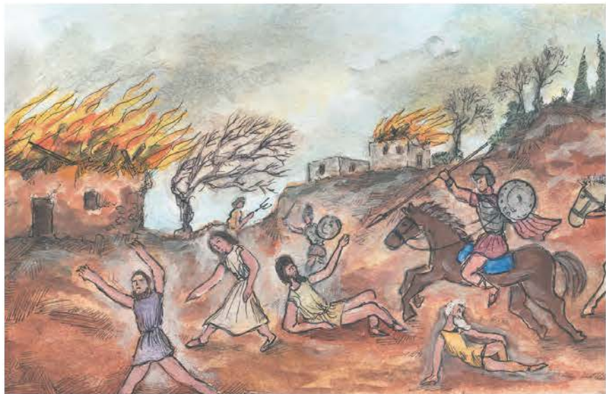
1. Οι ρωμαϊκές λεγεώνες λεηλατούσαν συχνά την ύπαιθρο.

Δυσάρεστες συνέπειες για τους Έλληνες όμως είχε και η διαρκής παρουσία ρωμαϊκού στρατού στον τόπο τους. Οι λεγεώνες τρέφονταν από τα προϊόντα της υπαίθρου και συχνά στρατολογούσαν τους κατοίκους της. Οι πληθυσμοί ένιωθαν ανασφαλείς και φοβισμένοι. Πολλοί εγκατέλειπαν τη γη τους και κατέφευγαν στις πόλεις. Κι εκεί όμως τους περίμεναν η φτώχεια, η διαρκής παρουσία και η απειλή των κατακτητών.