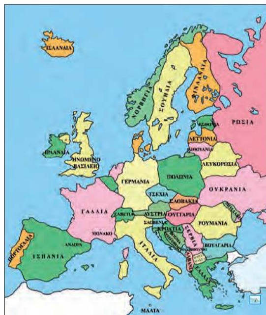
Εικόνα 7.2: Πολιτικός χάρτης της Ευρώπης

Παρατηρώντας τον διπλανό χάρτη ας καθορίσουμε τη γεωγραφική θέση της Ελλάδας στην Ευρώπη.