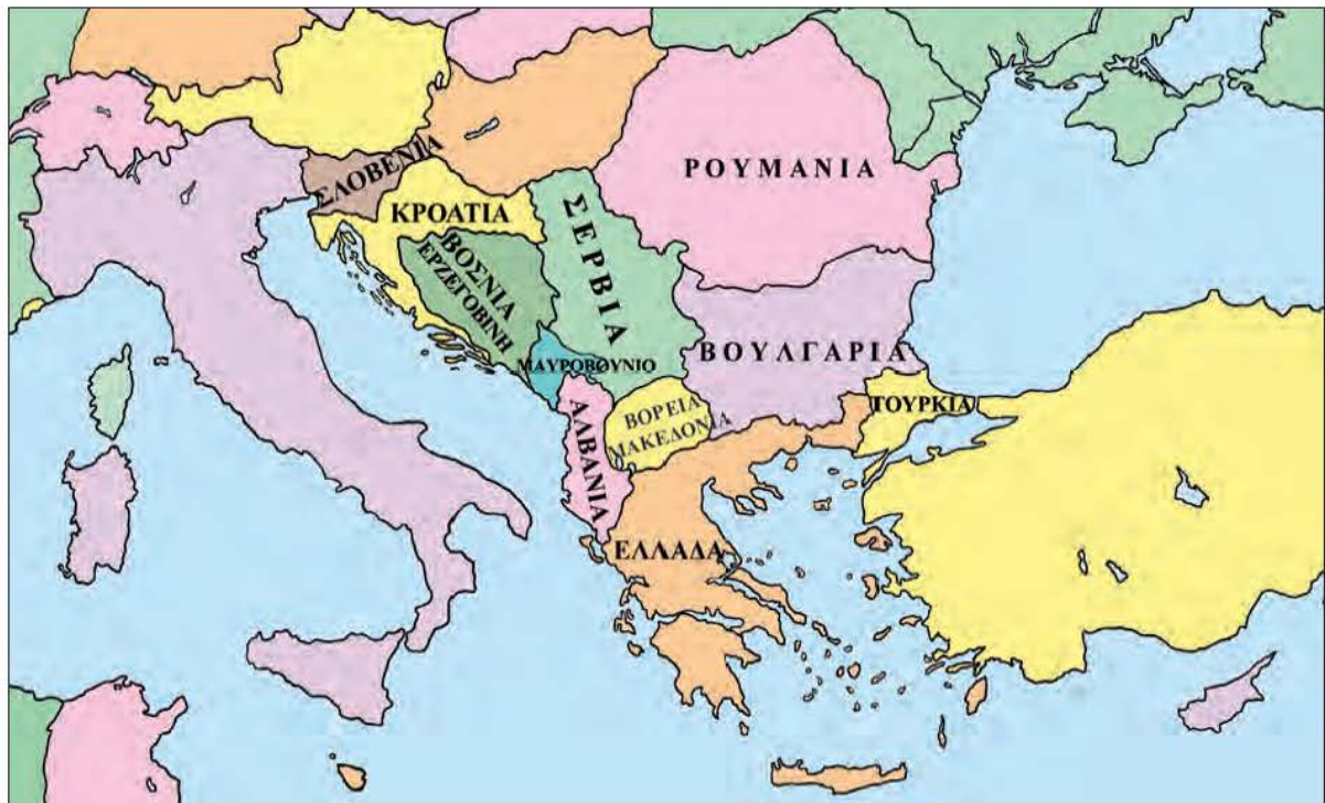
Εικόνα 7.3: Πολιτικός χάρτης Βαλκανικής χερσονήσου

Στον παρακάτω χάρτη βρείτε τα κράτη της Βαλκανικής χερσονήσου με τα οποία συνορεύει η χώρα μας και ορίστε τη θέση της Ελλάδας στη χερσόνησο αυτή. Ποια μεγάλη θάλασσα βρέχει τη νότια πλευρά της χώρας μας;