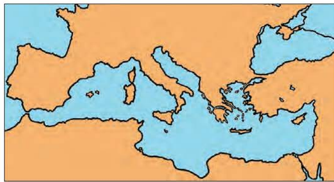
Εικόνα 6.2: Η Ελλάδα στον κόσμο και στην περιοχή της Μεσογείου