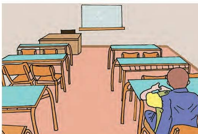
Εικόνα 5.1: Σχολική τάξη