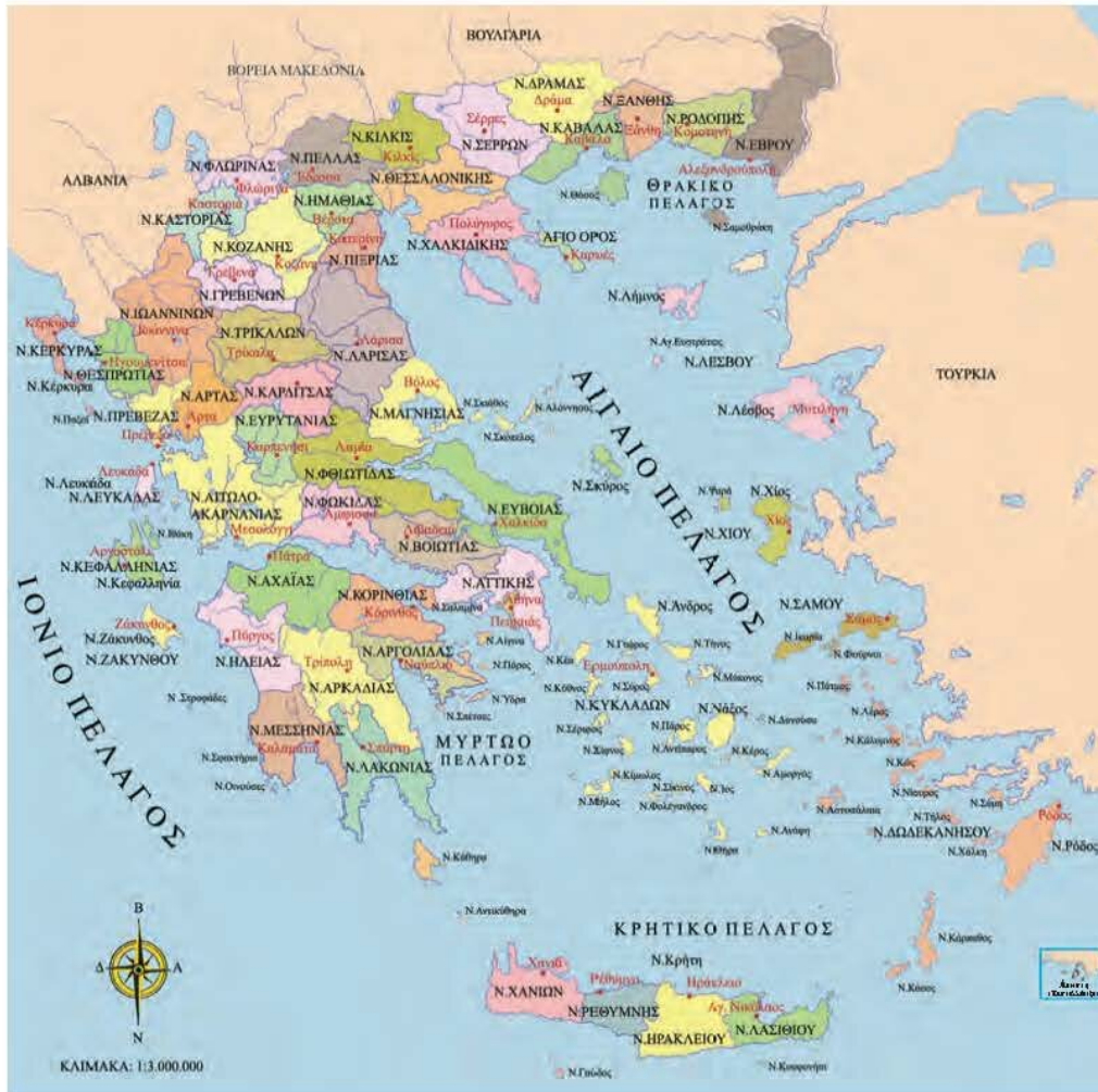
Εικόνα 5.3: Πολιτικός χάρτης Ελλάδας

Κάθε χάρτης είναι προσανατολισμένος, δηλαδή δείχνει τα τέσσερα σημεία του ορίζοντα. Το πάνω μέρος του χάρτη είναι ο Βορράς, το κάτω μέρος του χάρτη είναι ο Νότος, δεξιά του χάρτη βρίσκεται η Ανατολή και αριστερά του χάρτη η Δύση.