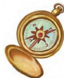
Εικόνα 5.4: Πυξίδα

Γνωρίζοντας πώς χρησιμοποιείται η πυξίδα προσανατολιστείτε στον χώρο δείχνοντας και τα άλλα σημεία του ορίζοντα.